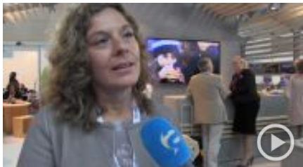
Turismo, Trentino: l'inverno parla russo, l'estate in coreano