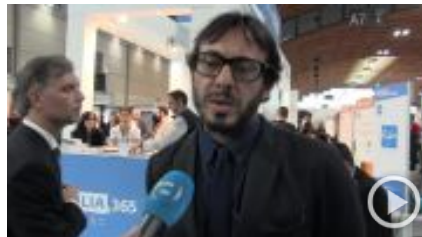
Turismo, Puglia investe sull'estero e attrae il Nord America